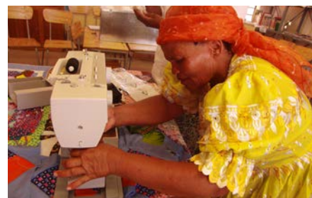
Foto: Parent teacher prøver skolens nye symaskin

Kostnader hele prosjektperioden: 6.244.470 Kostnader 2011: 1.379.507