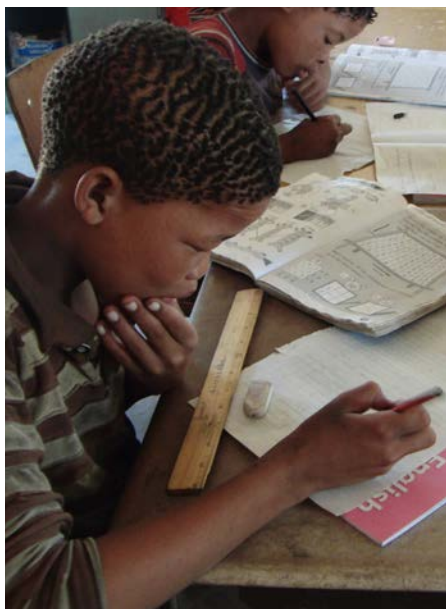
Foto: San-gutt jobber med skolearbeid på en landsbyskole utenfor Tsumkwe

I Tsumkwe og Mangetti, nordøst i regionen, har vi drevet San Education Project siden 2003, og det har hatt som hovedmål å styrke utdanningsnivået blant grupper av San-befolkningen. En av de viktigste faktorene i prosjektet er utdanning av lærere fra området. Disse gjennomgår et Basic Education Teacher Program. Parallelt med studiet underviser disse studentlærerne barn i 1. til 3. klasse på seks landsbyskoler i området. Programmet startet opp i 2008, og vil gå frem til 2012. Gjennom skoleåret følger Namibiaforeningen opp studentlærerne ved hjelp av