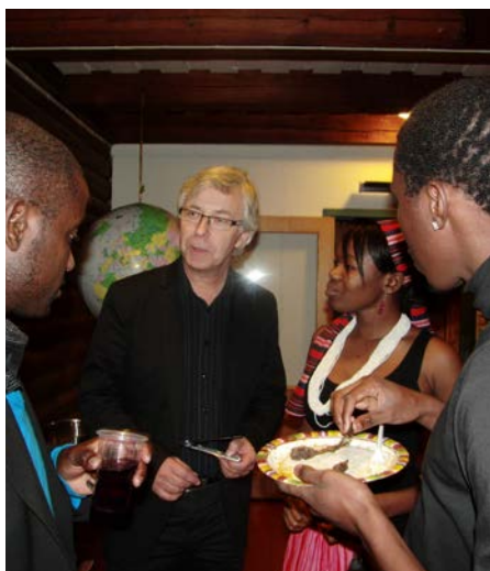
Foto: Fra Namibiakveld i internasjonalt senter i Namibiahuset.

I 2011 har innholdet på hjemmesiden variert fra markedsføring av egne arrangementer og prosjekter til nyheter om urbefolkning fra hele verden. I tillegg kommer vår grunnleggende informasjon om Namibiaforeningens arbeid og organisasjonsform. Hjemmesiden er Namibiaforeningens ansikt utad og får sterkere og sterkere prioritet. I tillegg til hjemmesiden ble facebook brukt som en